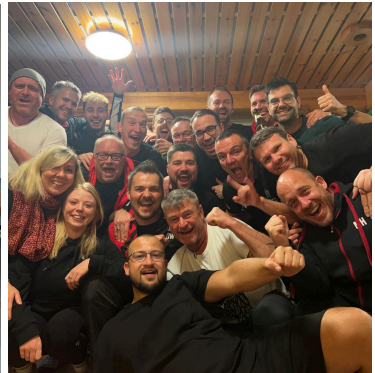
Grillfest in der Narrhalla und Trainingslager in Rodalben