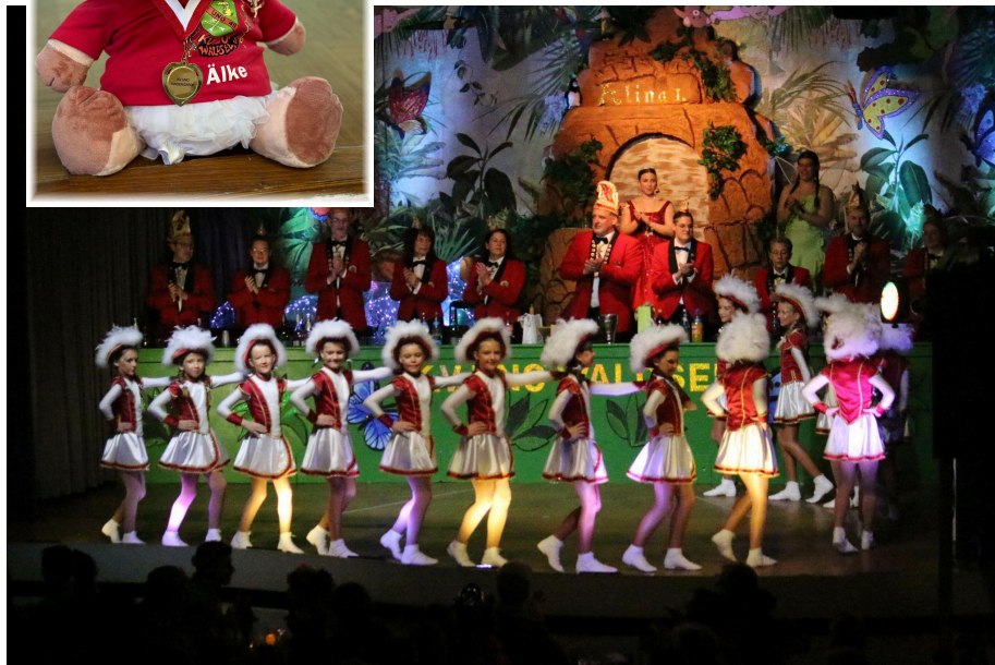
.... und auf der Prunksitzungsbühne.