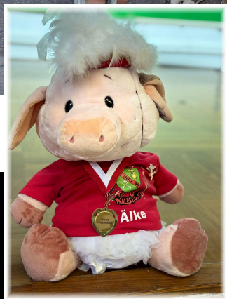
Die Kindergarde beim Fasnachtsumzug.....