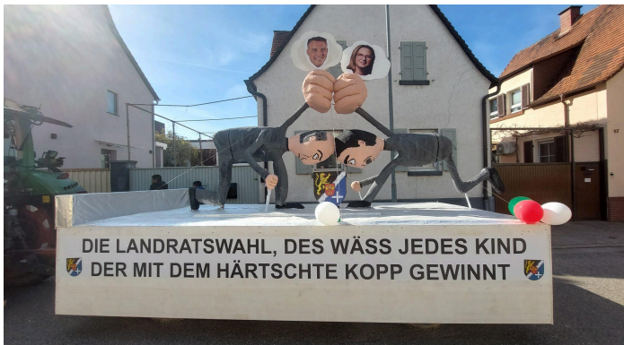
Typischer Waldseer Motivwagen