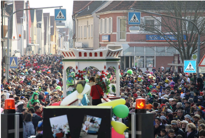
Gutsle von der Prinzessin und vom Elferrat