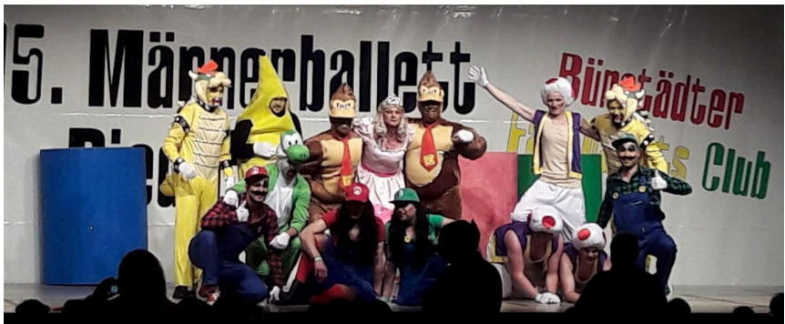
Beim Männerballett Turnier in Bürstadt