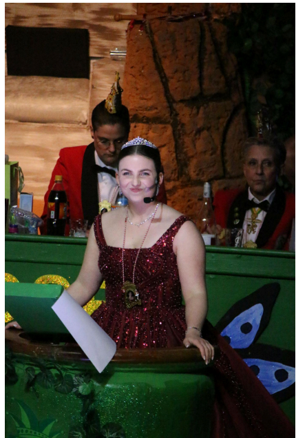
Frank Barchet “Appolonia Puhlschöpfer”