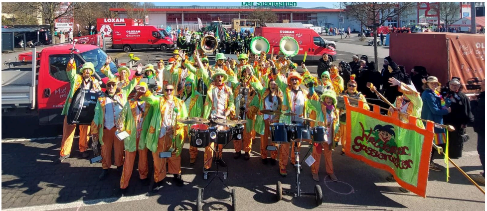
Beim Fasnachtsumzug in Heppenheim / Bergstraße