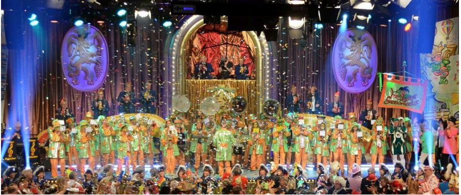
Bei der SWR - Fernsehfasnacht in Frankenthal