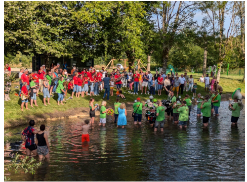
In unserer Partnergemeinde Ruffec